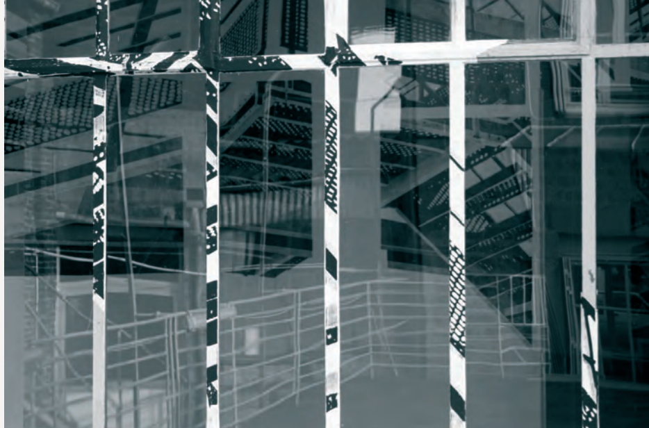
“L’escalier”, Galerie 2Angles, Flers 2007