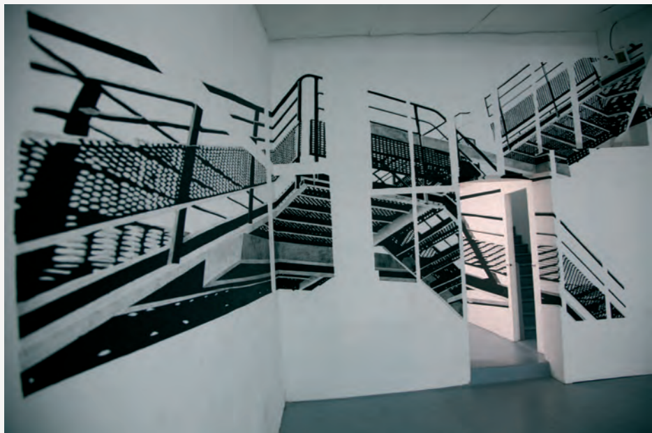
“L’escalier” (détail), Galerie 2Angles, Flers 2007