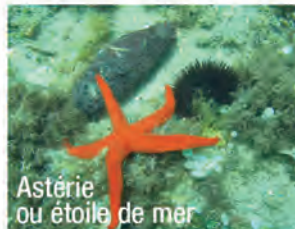
Astérie ou étoile de mer