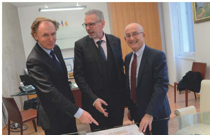
"Ce qui est bon pour un quartier est bon pour toute la ville"

Le député Jean-Louis Masson a souligné que "ce dispositif est avant tout un moyen de dissuasion pour éviter les rassemblements de personnes. 12 caméras sont déjà installées et nous avons eu beaucoup de retours positifs". La Sagem apporte également son soutien à la création d'associations d'aide (portage de courses, réalisation petits travaux...) et aux locataires qui souhaiteraient développer une activité commerciale au sein du quartier.