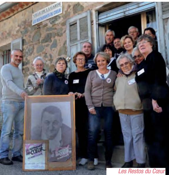
Les Restos du Cœur

Si tout au long de l'année des associations viennent en aide aux plus démunis, l'hiver est une période particulièrement sensible. Des hommes et des femmes apportent assistance, chaleur et réconfort. Zoom sur ces bénévoles qui font rimer hiver avec lumière.