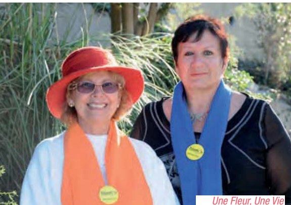
Une Fleur, Une Vie

L'association coordonne les animations menées au profit du Téléthon lors des Hivernales 2012. www.afm-telethon.fr