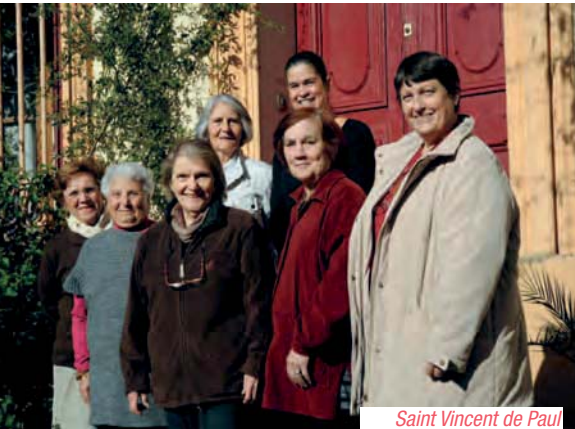
Saint Vincent de Paul