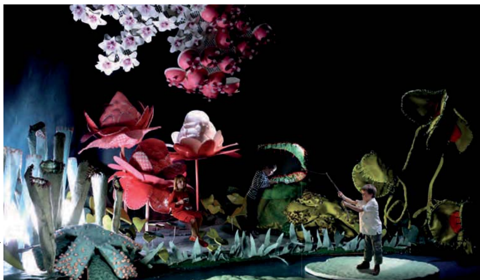
série Deep in the Forest

Concert dès 5 ans à partager en famille mardi 4 décembre séances scolaires à 10h et 14h30 et pour tout public à 19h Réservation au PJP 04 94 98 12 10 www.polejeunepublic.com