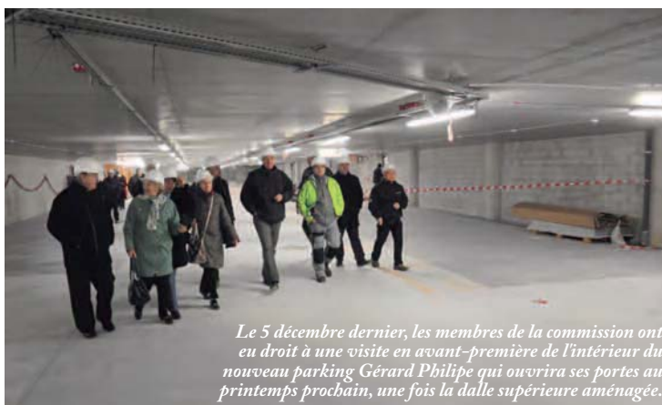
Le 5 décembre dernier, les membres de la commission ont eu droit à une visite en avant-première de l'intérieur du nouveau parking Gérard Philippe qui ouvrira ses portes au printemps prochain, une fois la dalle supérieure aménagée.