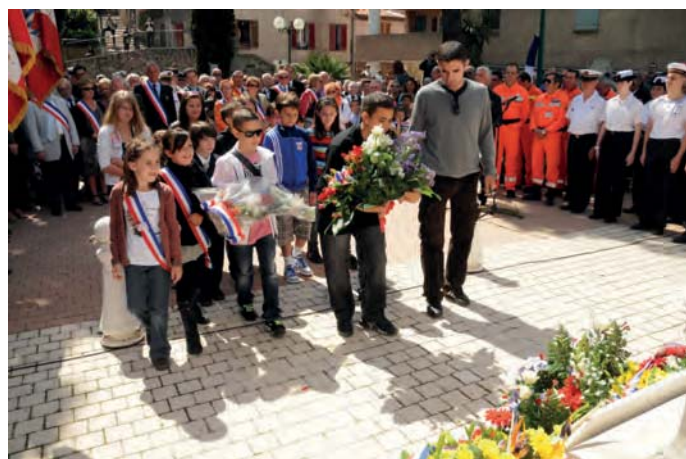
Les enfants participent aux commémorations de la ville encouragés par leur instituteur comme ici le 8 mai.