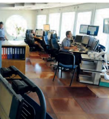
Le Cross Med compte 2 sites celui de La Garde et celui d'Aspretto en Corse. Ici, la salle d'opérations.