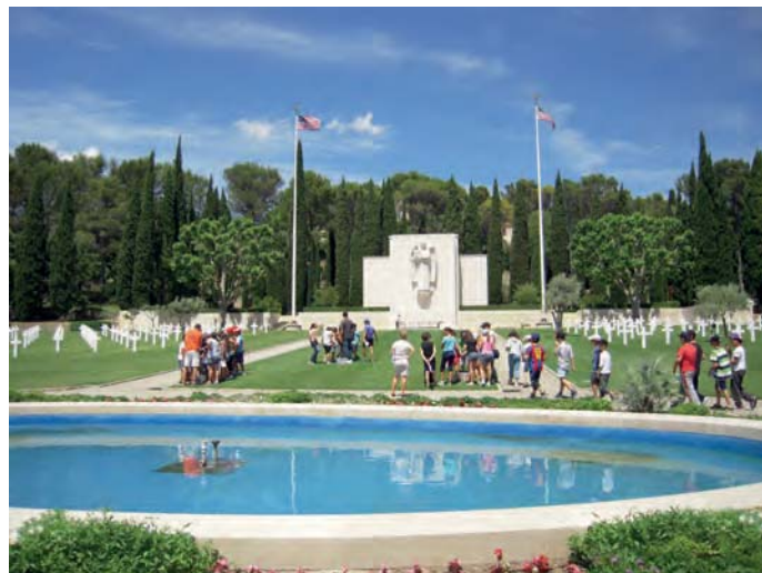
Le cimetière se divise en 4 parcelles. Parmi les pierres tombales, les oliviers confèrent au lieu une atmosphère paisible.