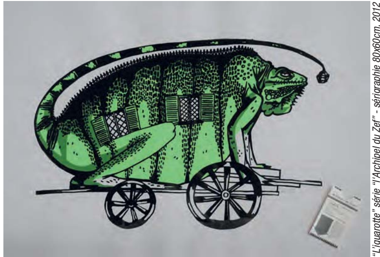
"L'iguarotte" série "l'Archipel du Zef" - sérigraphie 80x60cm, 2012