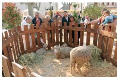
La mini-ferme pédagogique attire petits et grands...