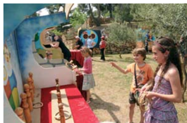
De nombreuses animations attendent les enfants au pique-nique du Thouars

Programme complet de la Fête du Printemps dans les points d'accueil municipaux et sur www.ville-lagarde.fr Renseignements > Maison du Tourisme 04 94 08 99 78