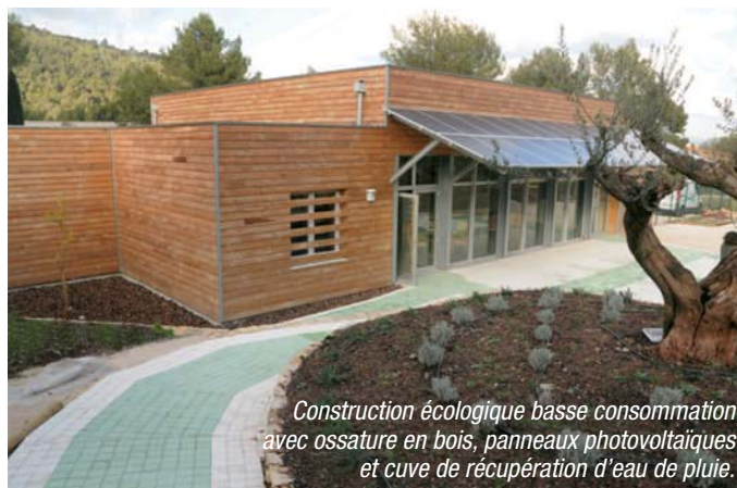
Construction écologique basse consommation avec ossature en bois, panneaux photovoltaïques et cuve de récupération d'eau de pluie.

Le fil d'argent est un centre novateur dans sa conception humaniste dans son fonctionnement pouvant accueillir 18 personnes atteintes de la maladie d'Alzheimer.