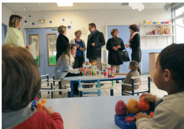
A droite : des espaces de jeux colorés et évolutifs au multi-accueil Les Elfes.