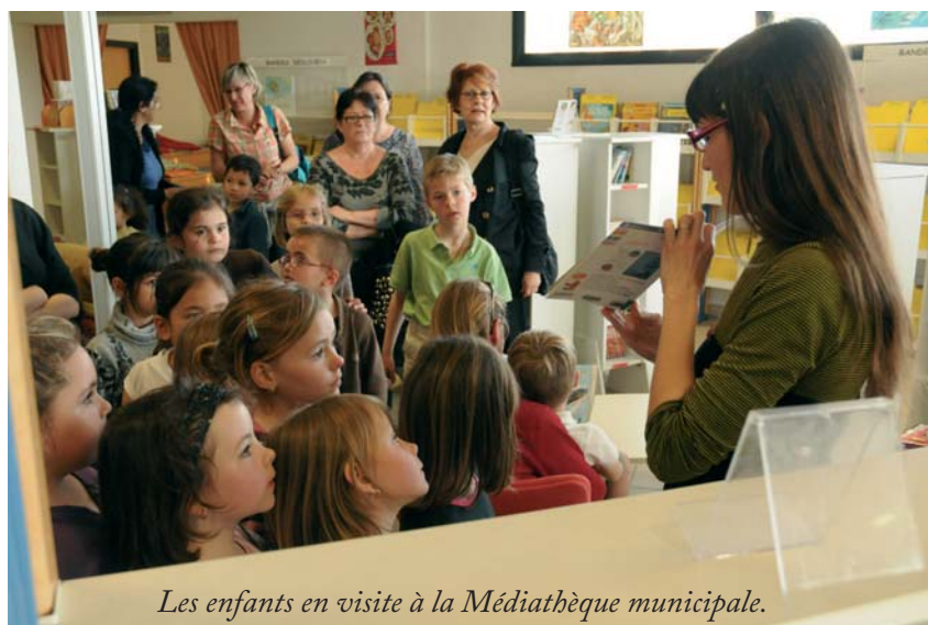
Les enfants en visite à la Médiathèque municipale.

participer à la vie du club et à l'accompagnement quotidien de leur enfant à la maison.