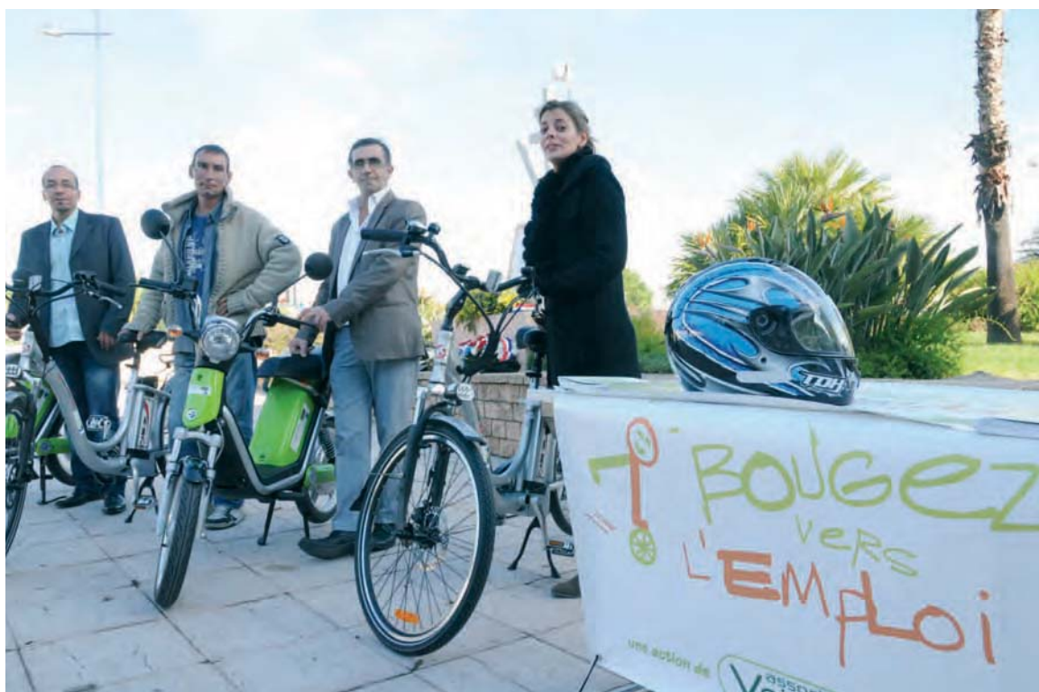
Vélos à assistance électrique, scooters thermiques ou électriques, le choix de véhicules proposés s'inscrit dans une démarche de protection de l'environnement.

Trois plateformes "Bougez vers l'emploi" quadrillent l'agglomération toulonnaise afin d'apporter des solutions de mobilité pour faciliter l'accès à l'emploi.