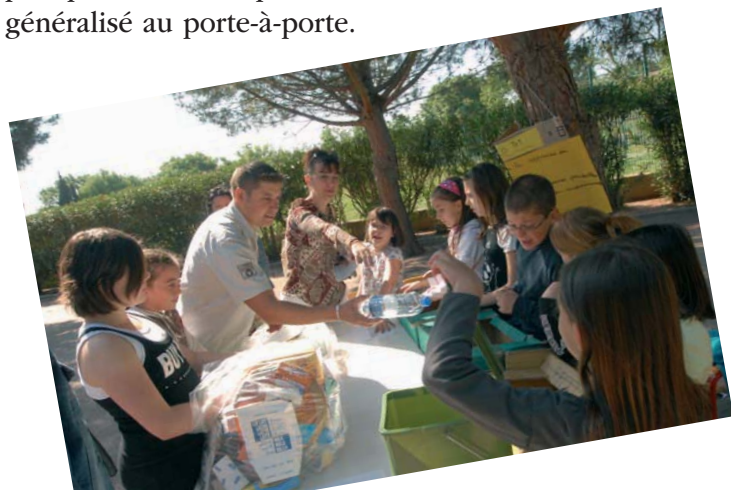
Des ateliers ludiques sur la sensibilisation au recyclage des déchets ont été animés par les enfants qui recevaient leurs parents dans l'enceinte de leur école, en juin dernier.

Pour obtenir le label Eco-école, il faut, au choix, travailler sur l'un des thèmes suivants : la biodiversité, l'eau, l'énergie, l'alimentation ou les déchets, durant une année scolaire. C'est ce dernier qui a été retenu par l'école. Un sujet ancré dans l'actualité de la commune en 2007 puisque notre cité passait alors au tri sélectif généralisé au porte-à-porte.