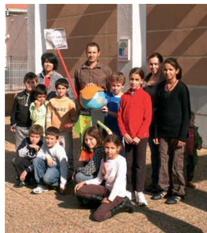
"Trier, c'est garder la terre Tonik !" proclame sur un panneau, l'effigie fabriquée par les enfants de l'école Maurice Delplace.