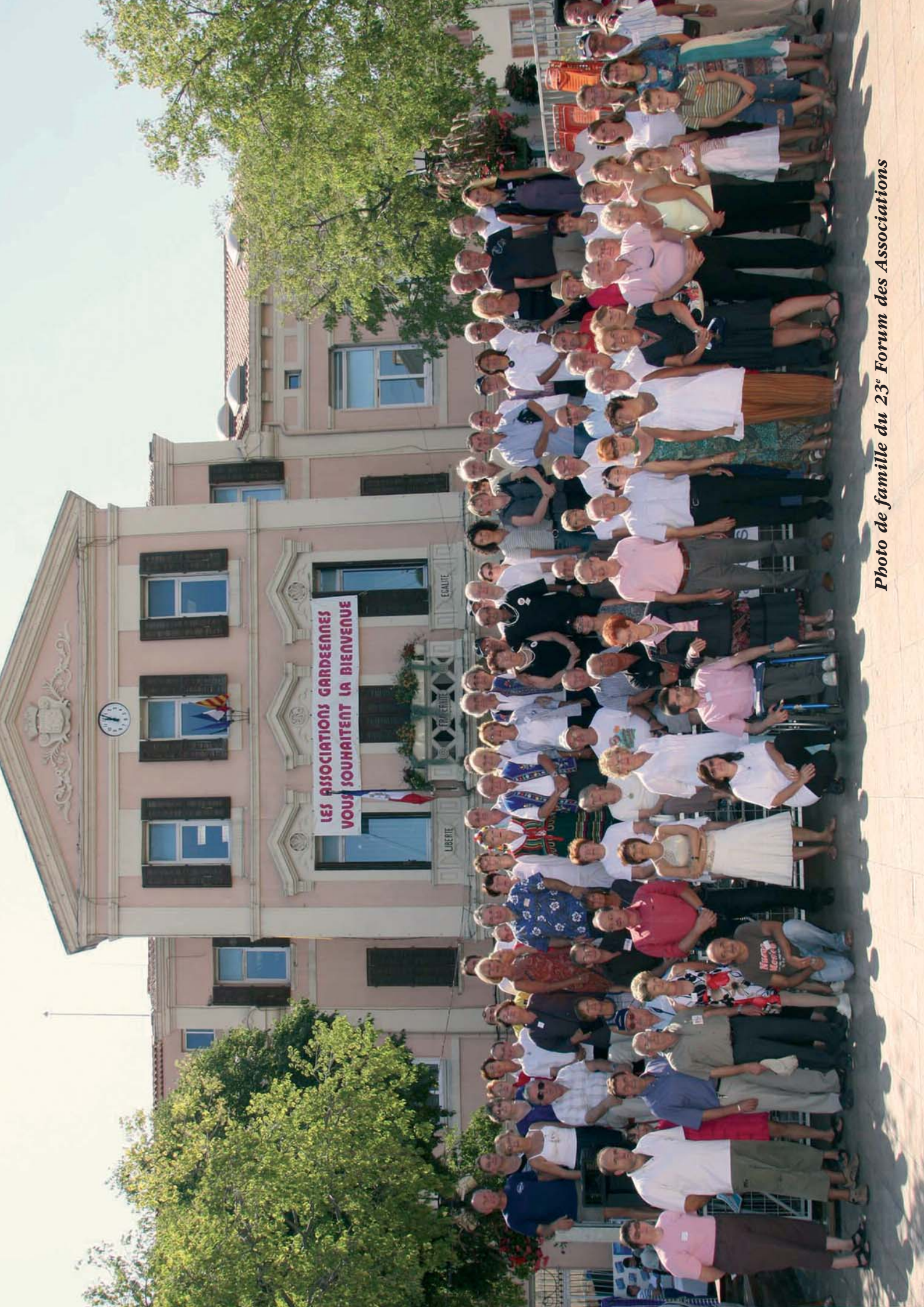
Photo de famille du 23 e Forum des Associations