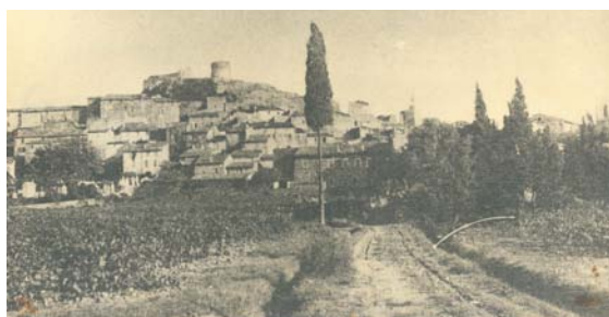
"une vue de ce qu'était notre parcelle achetée par ma grand-mère Mme Rostan en 1900..."