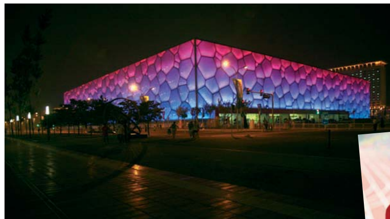
Le cube d'eau aux reflets changeants...