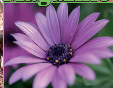
Fleurissez la ville