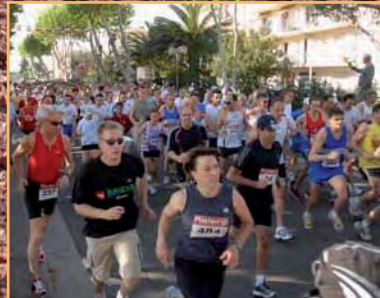
Départ du Mai sportif