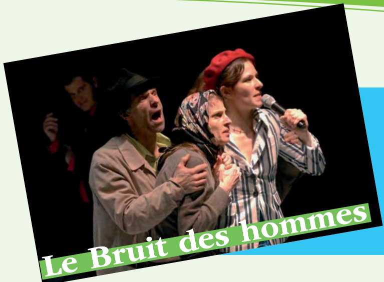
“Atteintes à sa vie”