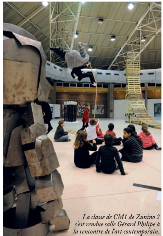
La classe de CM1 de Zunino 2 s'est rendue salle Gérard Philippe à la rencontre de l'art contemporain.