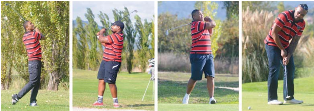
Élégance et décontraction pour les joueurs du RCT.

/// Prochain match à Mayol jeudi 1 er novembre à 14h30 : RCT/Stade Français.