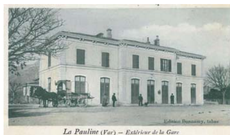
La Pauline (Var) — Extérieur de la Gare

“Histoire de La Garde” est disponible à la Maison du Tourisme et au Service Culturel (20 €) avec possibilité de dédicace.