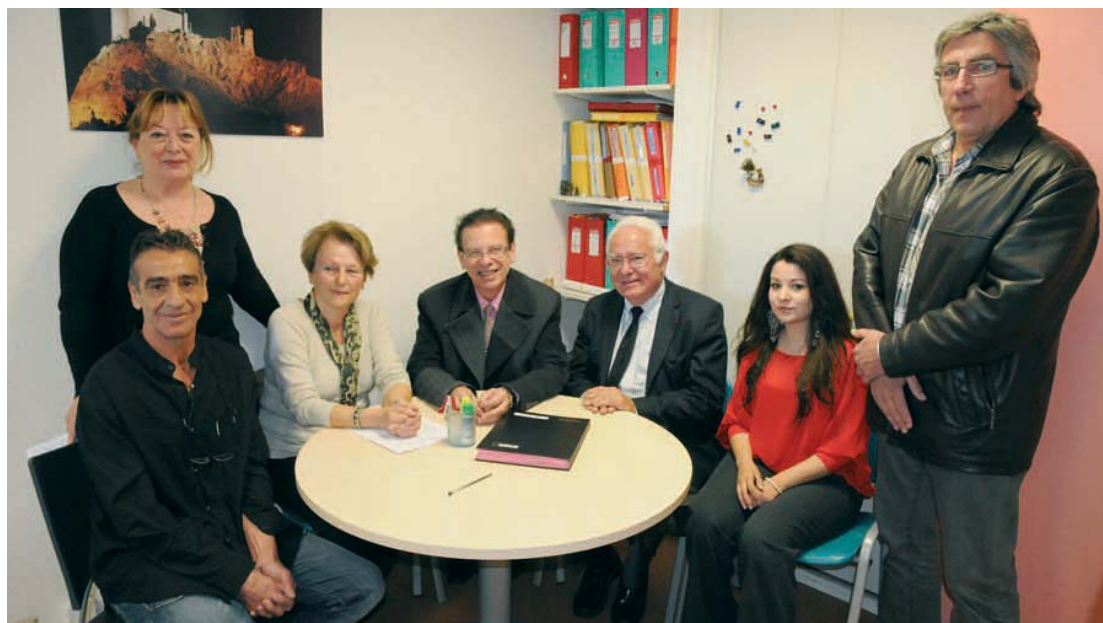
Présentation du nouveau service social en présence de Jean-Pierre Giran, député du Var.

Effectuer une veille sociale afin de lutter contre l'isolement et la précarité, sensibiliser la population sur les thèmes de la santé, tels sont les objectifs du nouveau service d'aide à la personne et du CLIPS.