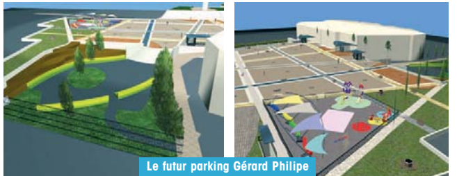
Le futur parking Gérard Philippe