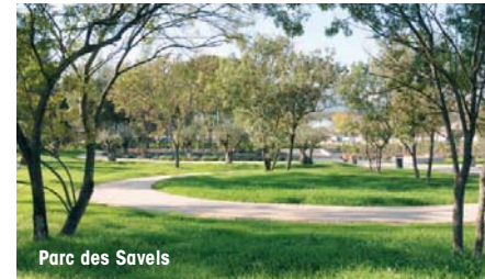
Parc des Savels

Vous avez raison d'en parler. C'est toujours vers demain que l'action publique nous conduit. La crise financière mondiale de 2008 est survenue après les élections municipales. Ce n'est pas un événement neutre y compris pour les finances locales. Nous avons tout de même choisi de continuer à baisser légèrement la pression fiscale pour les ménages et les entreprises. L'investissement annuel est resté quasi inchangé au alentours de 10 millions d'euros par an. Cela étant, peut-être serons nous contraints de différer un projet. Nous avons commencé le grand parking de centre ville et nous livrerons le pôle éducatif Santoni dans les délais. Bref, il n'y a pas d'inquiétudes majeures mais une vigilance accrue à avoir !