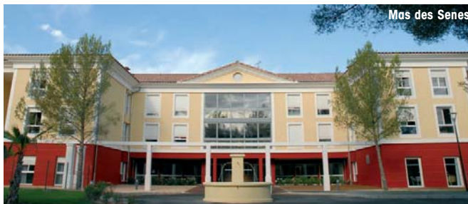
Mas des Senès