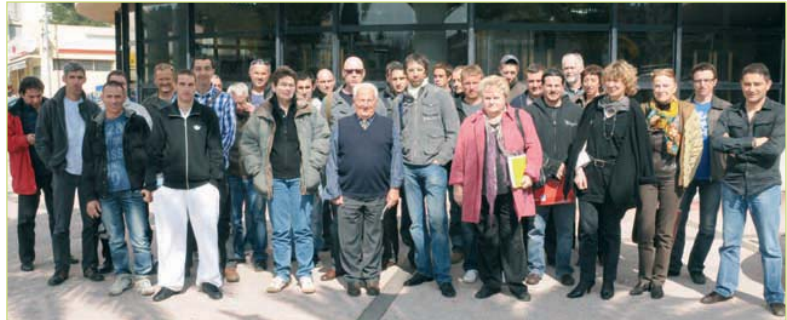
Tous sont repartis avec de nouvelles idées pour embellir notre quotidien dans le respect de l'environnement et des ressources naturelles.