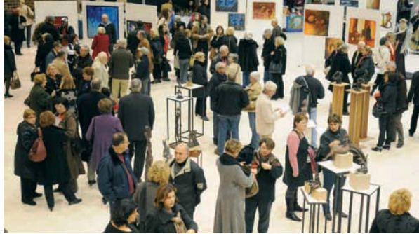
Chaque année des centaines de personnes sont présentes lors du vernissage pour apprécier des œuvres de qualité et soutenir l'action de BPW en faveur des femmes.

Trente femmes aux talents variés exposeront chacune trois de leurs œuvres lors du salon incontournable dédié à l'art au féminin. Initié par l'ONG BPW engagée pour la promotion de l'égalité professionnelle homme/femme et la lutte contre les discriminations dans le monde du travail, ce salon vise à montrer que la gente féminine, en manière d'art comme pour le reste, n'a rien à envier au sexe dit "fort".