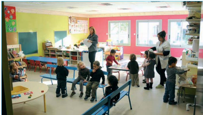
Les pitchounets s'adonnent à leur activité manuelle préférée dans un décor plus coloré.

D'ici septembre 2011, tous ces aménagements seront livrés. Coût des travaux : 430 000 € TTC.