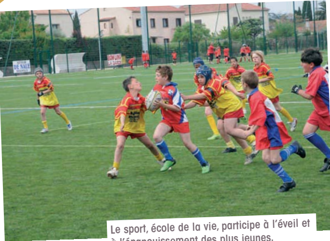
Le sport, école de la vie, participe à l'éveil et à l'épanouissement des plus jeunes.

Le 1 er décembre, l'Office des Sports a récompensé 302 athlètes qui ont porté haut les couleurs gardéennes. Sportifs, bénévoles, parents et élus se sont retrouvés en famille en salle Gérard Philippe. Retour sur une saison en or !