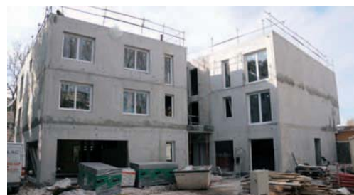
*CHRS : Centres d'Hébergement et de Réinsertion Sociale

Intégrée dans le réseau des Pensions de Famille de la Fondation Abbé Pierre, l'association Accueil Fémina Aglaé bénéficie du partenariat IKEA - Fondation Abbé Pierre. Ainsi, la résidence sera totalement équipée gratuitement par le magasin suédois basé à La Valette. Les résidents trouveront donc un "chez soi" équipé et confortable ainsi que des espaces communs conçus et aménagés pour une vie agréable.