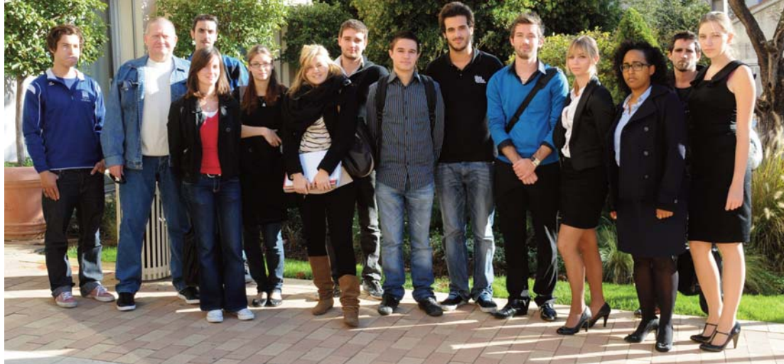
Première réunion pour une partie des étudiants mandatés pour ce diagnostic de territoire.

Renseignements complémentaires : 04 94 08 98 71