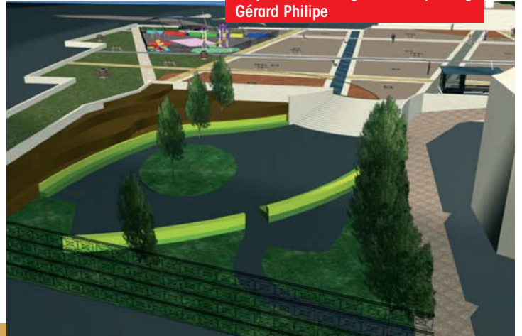
Projet de l'aménagement du parking Gérard Philippe

L'année à venir verra le début des travaux du futur parking Gérard Philippe. Cette réalisation d'envergure va permettre de libérer la surface des stationnements existants, permettant ainsi la création d'espaces paysagés. Trois parkings de délestage en périphérie permettront aux Gardéennes et Gardéens de se garer à proximité du centre-ville durant la construction. Dans cette même optique, l'effort sera maintenu dans le domaine des énergies renouvelables.