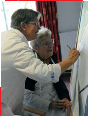
Objectif bien vieillir pour nos seniors dans des structures adaptées