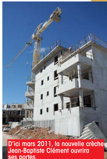
D'ici mars 2011, la nouvelle crèche Jean-Baptiste Clément ouvrira ses portes