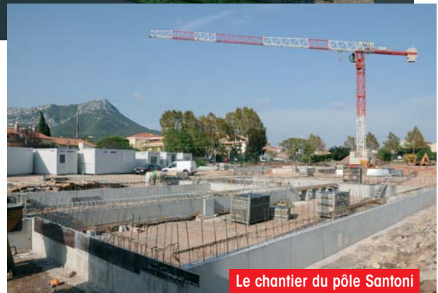
Le chantier du pôle Santoni