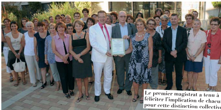
Le premier magistrat a tenu à féliciter l'implication de chacun pour cette distinction collective.

*Association Française pour l'Assurance de la Qualité / Association Française de Normalisation.