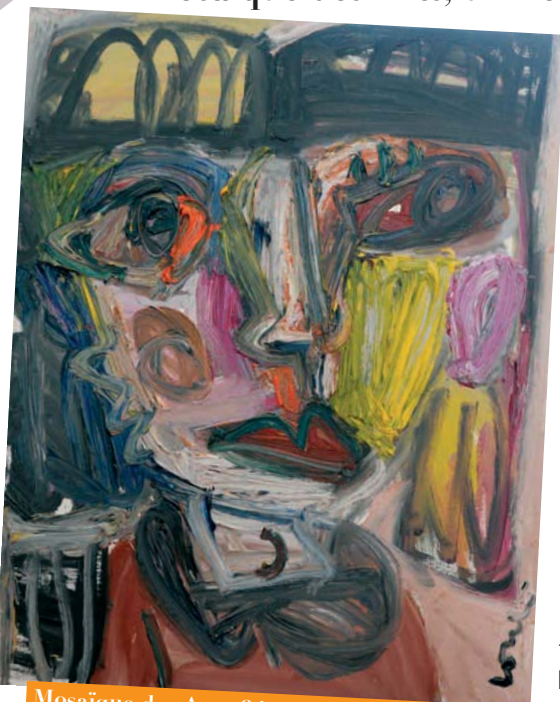
Mosaïque des Arts, 24 et 25 septembre, salle G. Philipe. Vernissage le 24 septembre - 11h30

Mosaïque des Arts, un nom qui annonce les couleurs : L'Art sous toutes ses formes.