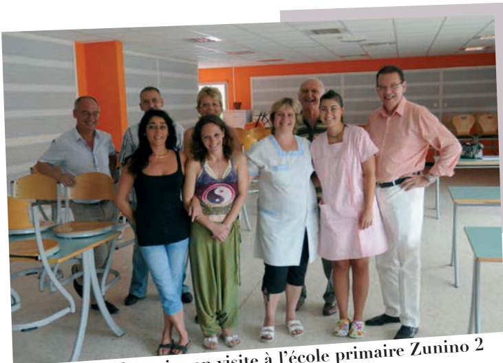
Monsieur le maire en visite à l'école primaire Zunino 2 dont le réfectoire a été refait et insonorisé.

Durant l'été, de nombreux travaux ont été effectués par les services municipaux dans les écoles élémentaires, maternelles et les structures petite enfance.