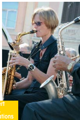
Le concert de l'Harmonie Mussou a ouvert cette journée de partages et d'échanges. Fondée en 1851, la doyenne des associations gardéennes a ravi petits et grands.