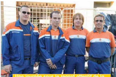
Une journée sous le regard attentif de la Protection Civile venue assurer la surveillance des nombreux visiteurs.