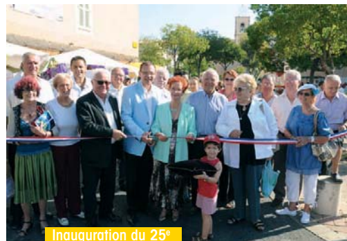
Inauguration du 25 e Forum des Associations par M. le maire et toute l'équipe municipale.

Cours de danse flamenco et de sevillanas pour les adultes, les enfants et les adolescents au Mas de La Beauessière. Horaires enfants : mercredi 10h15/11h15 (5/8 ans), mercredi 16h/17h (9/13 ans). Horaires adultes : mercredi 17h/18h