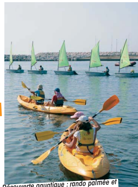
Découverte aquatique : rando palmée et canoë pour les petits mousmes...

UNE CHOSE EST SÛRE : VIVEMENT LES PROCHAINES VACANCES !