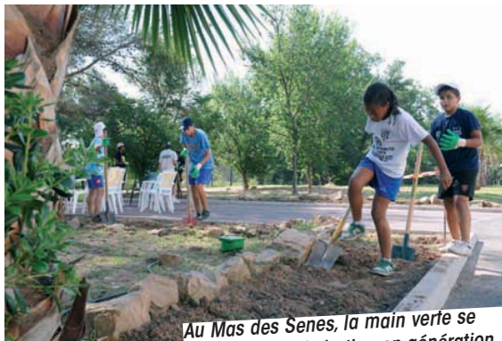
Au Mas des Senès, la main verte se transmet de génération en génération...

Les animateurs du service jeunesse ont une nouvelle fois concocté un panaché fruité. La recette ? Des rallyes pour partir à la rencontre des fonds marins, des initiations au parapente, à l'escalade ou à la spéléologie pour les aventuriers, des balades dans la nature afin de découvrir notre littoral, des nocturnes paint ball ou jeux sur le sable, une semaine en camping pour s'initier au surf, le tout saupoudré de soirées au clair de lune ou dans les salles obscures, et pour les lève-tard des activités adaptées aux "grasses mat"... Une règle : choisir son activité selon son envie. Pour tous les goûts on vous dit !