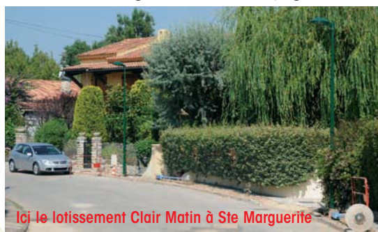
Ici le lotissement Clair Matin à Ste Marguerite

L'enjeu de l'éclairage public est de maintenir un haut niveau de prestations pour les riverains et les usagers tout en conjuguant économie, confort et sécurité.