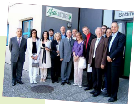
Rencontre à l'AFUZI avec le tissu économique local.

Monsieur le maire a tenu à rappeler les nombreux échanges entre nos deux communes. "En 30 ans, nombreuses ont été les occasions de vivre pleinement notre jumelage, par le biais de rencontres sportives notamment. La venue de ces lycéens qui ont étudié auprès des élèves Gardéens, est un gage supplémentaire de la dynamique qui a animé ce voyage." Les 30 prochaines années vont ainsi pouvoir pousser sur un terrain fertile.