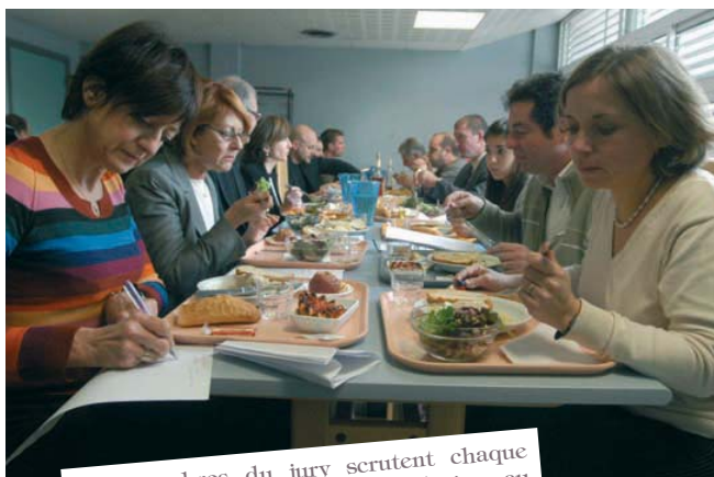
Les membres du jury scrutent chaque détail, de l'affichage du menu du jour au respect des quantités des plats servis.

M. Guillet, principal : "Sachez que l'équipe de restauration du Collège Cousteau sert chaque jour plus de 400 repas aux élèves et au corps enseignant. En participant à cette opération, nous voulons valoriser nos chefs et leurs équipes qui ont à cœur de proposer un repas équilibré."