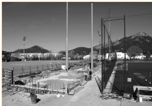
Livraison prévue en décembre 2008