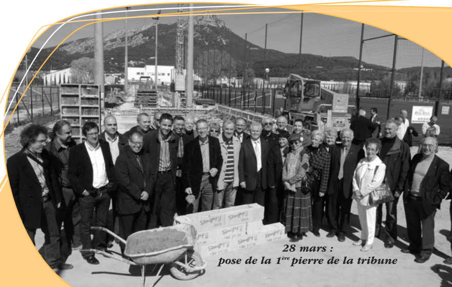
28 mars : pose de la 1 ère pierre de la tribune

La Garde, ville sportive par excellence, offre avec plaisir à ses clubs des infrastructures sportives à l'image de leurs victoires départementales, régionales, nationales et même internationales.