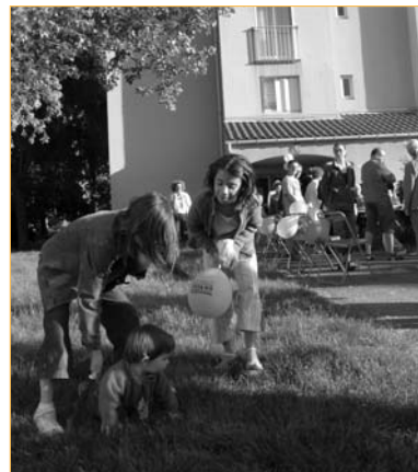
L'an dernier, nous étions plus de 5 millions de français à prendre part à cette grande fête entre voisins.

La ville de La Garde s'est vue remettre le label "ville conviviale, ville solidaire" en début d'année, un signe de son engagement au quotidien dans le mieux vivre ensemble. La fête des voisins est un événement de proximité qui a pour principe de créer un lien social en incitant les gens à se rencontrer, à partager un moment agréable dans un contexte familial. Les beaux jours aidant, il vous sera aisé d'installer une table en plein air et de préparer un buffet... Chacun apporte un peu de son savoir-faire culinaire et de quoi trinquer et la soirée n'en sera que plus inoubliable !