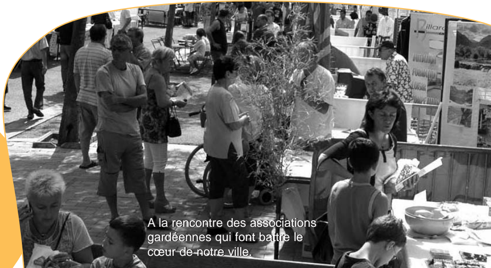
A la rencontre des associations gardéennes qui font battre le cœur de notre ville.

Programme distribué dans les boîtes aux lettres et disponible à la Maison du Tourisme, à l'accueil de la mairie et à la Maison des Associations. Buvette sur place. Renseignements : 04 98 01 15 71