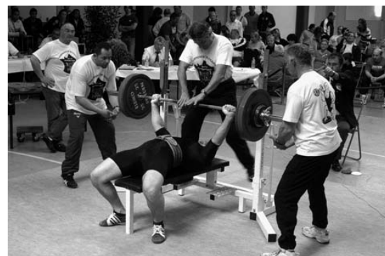
Dépassement de soi et maîtrise du geste : chaque poids soulevé par ces athlètes est un exploit.

Entrée libre - Cérémonie d'ouverture lundi 3 septembre à 9h, en présence de nombreux officiels de la Ville, du Département, de la Région et de la Fédération. - Début des compétitions à 10h le 3 septembre (et non le 4, en raison du grand nombre d'inscrits) Village d'exposants produits du terroir Pour + d'infos : www.comite-var-hmfac.com