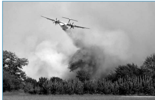
Les Dash 8 de la sécurité civile, premiers sur les lieux, ont largué plusieurs tonnes de retardants sur les arbres menacés.

A 14h08, le poste d'observation du point d'eau du Mont Caume donne l'alerte. Des Dash 8 de la sécurité civile, alors en mission de guet aérien, entreprennent avant même l'arrivée des véhicules, d'éteindre le début d'incendie