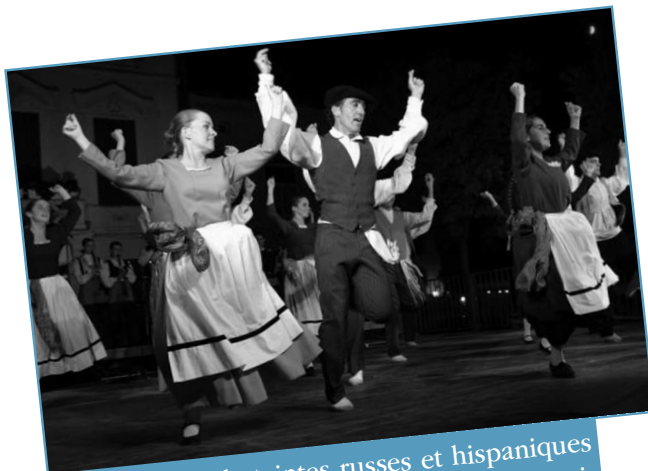
Une explosion de teintes russes et hispaniques a envahi la place de la République. Deux soirées folkloriques inoubliables dans le cadre du Festival Couleurs du Monde.

Inscriptions pour les enfants nés en 2005 du 27 au 31 août de 8h30 à 10h30. Se munir de la feuille de pré-inscription mairie, du carnet de vaccination et du livret de famille.