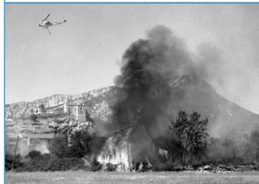
Plusieurs centaines de sapeurs-pompiers de tout le département ont œuvré sans relâche.

Quatre hélicoptères bombardiers d'eau survolaient en ce 9 août, La Garde aux prises avec les flammes.