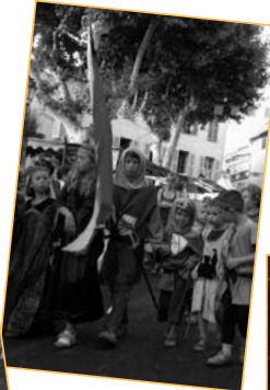
Concours de costumes des Tisseurs de Rêves...