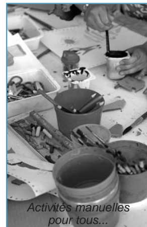
Activités manuelles pour tous...

Mas de la Beaussière : avenue Jacques Duclos, rsd Romain Rolland, 9h-12h et 14h-18h, 04 94 21 38 63. Programme complet disponible à l'accueil. Association Ressource : 265, Mail de la Planquette, 9h-12h et 14h-18h, 04 94 21 81 44.