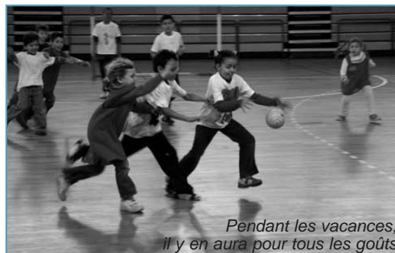
Pendant les vacances, il y en aura pour tous les goûts

Pour profiter des vacances à 100%, voici les programmes du Mas de La Beaussière et de l'association Ressource.