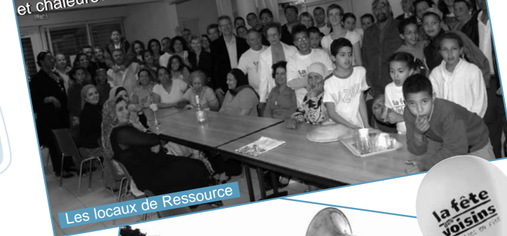
Les locaux de Ressource

Des scènes émouvantes d'anciens et de nouveaux Gardéens, de jeunes et moins jeunes, réunis dans une ambiance festive et chaleureuse.