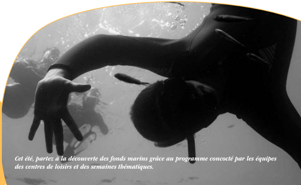
Cet été, partez à la découverte des fonds marins grâce au programme concocté par les équipes des centres de loisirs et des semaines thématiques.

La Poste : 04 94 14 71 80 N° vert départemental : 0800 10 10 83 Mairie : 04 94 08 98 00 Mairie annexe Ste Marguerite : 04 94 48 85 76 Allo Mairie : 0800 50 59 92 Maison du Tourisme : 04 94 08 99 78 / 04 94 08 99 99 Resto du cœur : 04 94 08 30 42 Déchetterie : 04 94 14 04 92 Encombrants n°vert : 0800 21 31 41 Portage repas domicile : 04 94 08 98 83 Clic du Coudon : 0 825 30 14 14 Site : www.ville-lagarde.fr e-mail : contact-mairie@ville-lagarde.fr