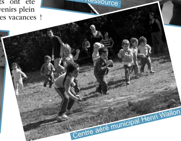
Centre aéré municipal Henri Wallon