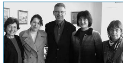
Indépendamment du séminaire franco-libano-allemand, deux enseignantes roumaines ont également fait le déplacement à La Garde, afin de visiter les structures dédiées à l'enfance pour s'inspirer des pratiques et les exporter dans leur pays.

Début avril, le CLAE de La Garde a accueilli le dernier volet d'un séminaire franco-libano-allemand composé d'une vingtaine de professionnels de l'enfance. Un cycle de rencontres commencé à Saïda (Liban) en avril 2006 et poursuivi à Berlin en mars dernier. Chacun a pu observer et apprendre des pratiques pédagogiques appliquées dans les autres pays. Un dernier épisode français donc, qui a porté un regard attentif sur les pratiques culturelles et artistiques des jeunes. Les enfants du CLAE ont offert leurs dessins représentant leur vie en France aux