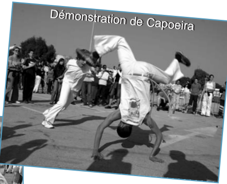
Démonstration de Capoeira

Une journée ensoleillée sous le signe du sport : partage, échange, convivialité et complicité !