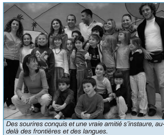
Des sourires conquis et une vraie amitié s'instaure, au-delà des frontières et des langues.