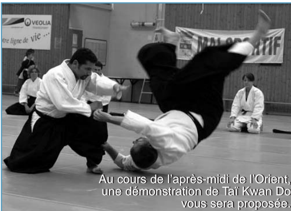
Au cours de l'après-midi de l'Orient, une démonstration de Tai Kwan Do vous sera proposée.