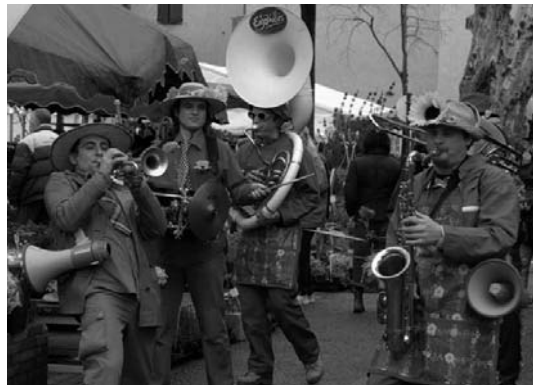
Une ambiance musicale assurée par les Enjoliveurs a ravi la foule ! Ils nous ont fait partager leur gaieté et bonne humeur, par des chansons burlesques sur le thème de la nature.