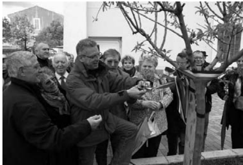
M. le Maire a planté un amandier, symbole de La Garde, sur le parvis de l'Hôtel de Ville en présence d'une foule nombreuse.

Dimanche 1 er avril, une ode au Printemps a résonné au cœur de la cité du Rocher. La Foire aux Plants a fédéré Gardéens et Varois, amateurs des délices de la nature. Un grand rassemblement familial porté par la joie de tous, où les plus jeunes ont pu s'exercer à la composition florale et les adultes choisir les futures plantations qui agrémenteront