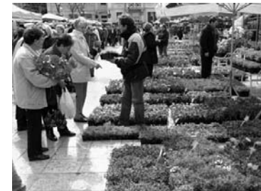
Tout pour remporter le premier prix du concours Maisons fleuries ! Rosiers, frélias, géraniums, azalées, lavande, bougainvilliers... plaisir des yeux et des odeurs, grâce à la grande diversité des plantes proposées par les 70 exposants.

leurs balcons et jardins. Parmi les conseils dispensés aux jardiniers en herbe : les amandiers, comme les amoureux, vont toujours par deux ! Une recommandation que M. le maire ne manquera pas de suivre, pour le nouvel amandier planté devant l'Hôtel de Ville... A l'année prochaine !