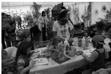
L'association Mag'Momes a proposé aux enfants des ateliers autour du thème de la fleur : conception de bouquets de table, de fleurs en papier crépon, peinture ou encore réalisation de chapeaux fleuris. Tout pour exprimer sa créativité !

De la place Victor Hugo jusqu'à la rue Raspail, le centre-ville s'est transformé en ferme pédagogique. Petits et grands ont pu s'initier à la traite des chèvres, à la fabrication du beurre en passant par la confection du miel. Lapins, chèvres, canards et cochons ont particulièrement fait sensation auprès des enfants. L'occasion aussi de découvrir des espèces moins répandues, comme le taureau nain à poil long.