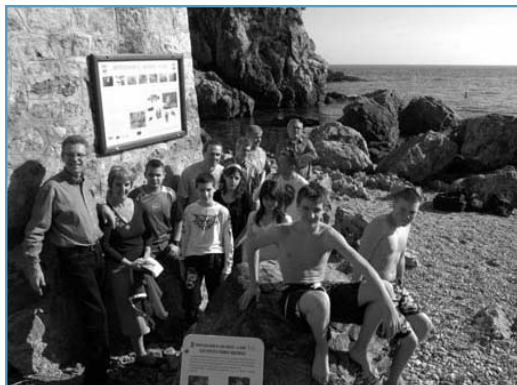
Les jeunes et les élus lors de la pose de la plaque situant le début du parcours, en cette belle journée du 14 mars.

La Garde est une ville riche de 3 km de littoral préservé. Aujourd'hui, le sentier sous-marin de l'Anse Magaud permet à tous de découvrir les fonds marins. Les caméras aquatiques dont il est équipé en font un sentier unique.