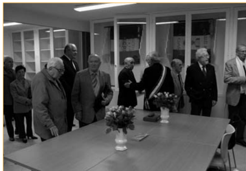
Les anciens combattants bénéficient désormais d'un lieu agréable pour se réunir.

souhaitent connaître le passé de leur pays". Une bibliothèque permettra ainsi d'enrichir les moyens de connaissances (les documents des anciens combattants y sont d'ailleurs les bienvenus).