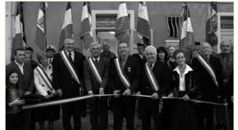
Après avoir coupé le ruban inaugural, les élus et les gardéens, ont pu apprécier la Marseillaise, jouée par l'Harmonie Mussou.

voir que les gens se sentent concernés par notre devoir de mémoire. Cette maison sera le lieu de tous les échanges : pour se retrouver, honorer les familles et recevoir les jeunes qui