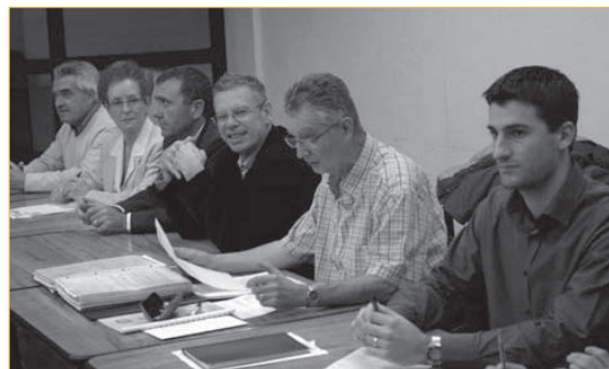
D'ici trois ans, tous les Gardéens pourront profiter de ce poumon vert qui couvre quasiment la moitié du territoire communal

Le Parc Nature réalisé par le Conseil général : aménagement de 128 hectares permettra la valorisation et la préservation de la faune et de la flore du Plan. Au programme, la création d'une Maison de la Nature ainsi qu'un réseau de pistes pour déplacements doux (vélos, piétons, chevaux...). S'ajouteront aux jardins familiaux, des jardins pédagogiques ainsi qu'un parc arboré et un travail paysager sur les cours d'eau.