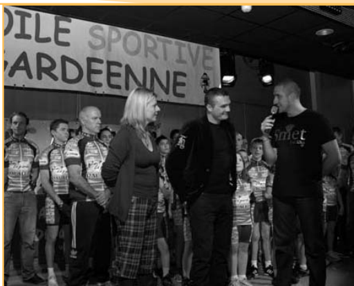
Virenque s'est remémoré avec émotion ses années au Vélo Club Gardéen, de 15 à 17 ans. Normal pour lui de soutenir la relève qui est toute assurée.