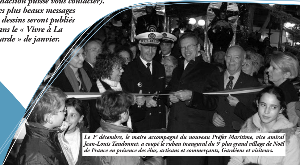
Le 1 er décembre, le maire accompagné du nouveau Préfet Maritime, vice amiral Jean-Louis Tandonnnet, a coupé le ruban inaugural du 9 e plus grand village de Noël de France en présence des élus, artisans et commerçants, Gardéens et visiteurs.

La Poste : 04 94 14 71 86 N° vert départemental : 0800 10 10 83 Mairie : 04 94 08 98 00 Mairie annexe Ste Marguerite : 04 94 48 85 76 Allo Mairie : 0800 50 59 92 Maison du tourisme : 04 94 08 99 78 / 04 94 08 99 99 Resto du cœur : 04 94 08 30 42 Déchetterie : 04 94 14 04 92 Encombrants n°vert : 0800 21 31 41 Portage repas domicile : 04 94 08 98 83 Clic du Coudon : 0 825 30 14 14 e-mail : contact-mairie@ville-lagarde.fr Site : www.ville-lagarde.fr