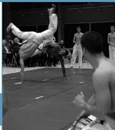
Des démonstrations époustouflantes ont ponctué la soirée. Ci-contre les Volcan Kreol