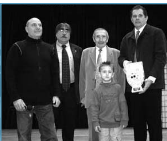
Pour sceller l'amitié entre le club de Furiani et le Judo club, un représentant corse a remis un trophée au responsable gardéen.