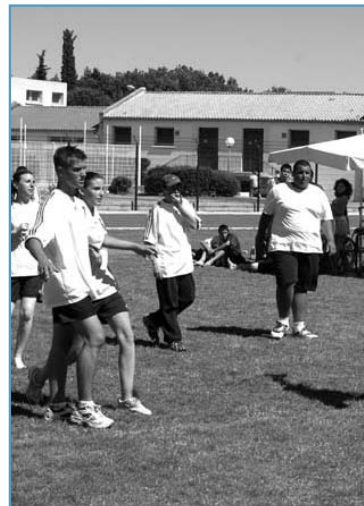
Tournoi de Hand-ball - Hand-ball Club G