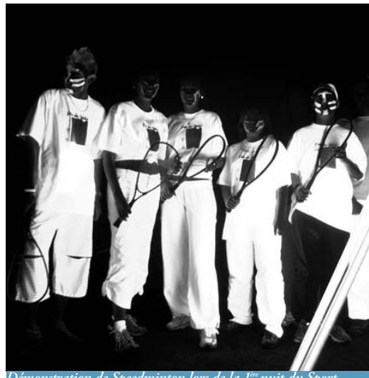
Démonstration de Speedminton lors de la 1 ère nuit du Sport