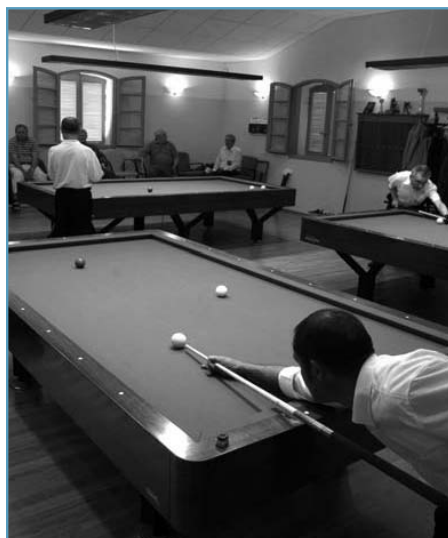
Tournoi régional open 3 bandes Ajs Billard club gardéen : 04 94 61 45 55