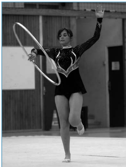
Démonstrations de gymnastique rythmique. AJS Gymnastique rythmique 04 94 35 26 09