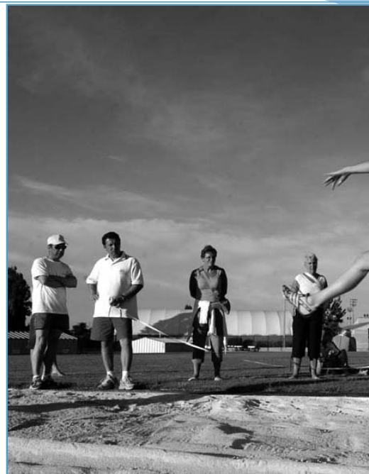
Meeting régional d'athlétisme - AJS La Garde Athlétisme