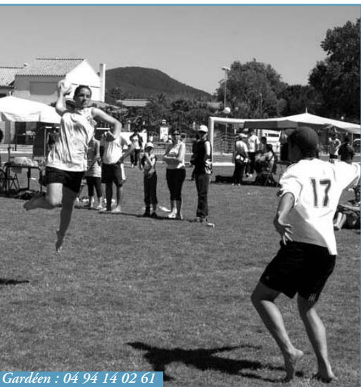
Gardéen : 04 94 14 02 61