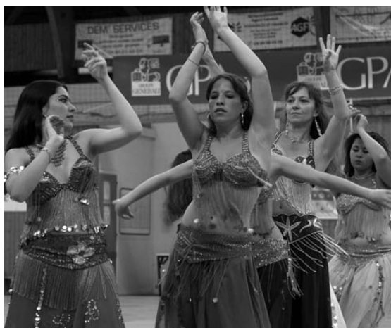
Après-midi de l'Orient - Démonstration de danses orientales