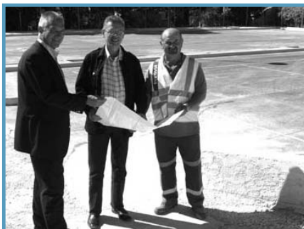
Le Maire et le 2 e adjoint constatent l'avancée des travaux du nouveau parking.

La ville aménage un grand parking sur le site de la piscine. Désormais, une centaine de places facilite le stationnement et fluidifie la circulation pour la plus grande satisfaction des riverains et des utilisateurs.