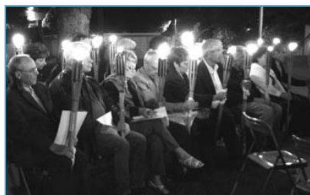
Rassemblement pour la veillée aux Flambeaux, en présence des Porte-Drapeaux et de la Fédération Nationale des Déportés et Internés, Résistants et Patriotes.

La Garde s'est attachée à donner un éclat particulier aux cérémonies commémorant la déportation. Deux jours de recueillement poignant, une veillée aux flambeaux, des lectures, des chants sont venus aviver la flamme du souvenir. Un souvenir qui rend hommage à tous ceux qui ont eu à souffrir des horreurs commises par des idéologies barbares. Un souvenir qui s'inscrit également dans une lutte sans relâche contre les totalitarismes afin de préserver la paix, la tolérance et la fraternité. Désormais ce combat sera symbolisé au quotidien par l'illumination du monument aux morts.