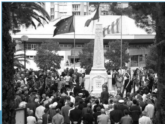
Beaucoup de monde et d'émotion lors de la commémoration de l'armistice du 8 mai 1945.