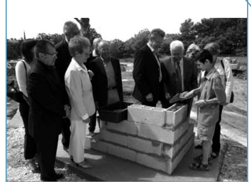
Symboliquement un jeune du CMJ a posé la 1 ère pierre