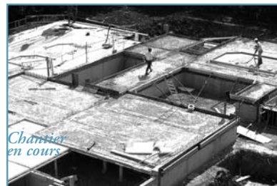
Chantier en cours

- "Le site choisi est exceptionnel !" : situé en pleine ville, il permettra de créer un parc urbain de 1,5 ha, sécurisé, aménagé, ouvert à toute la population et destiné à favoriser le maintien du lien social avec les anciens.