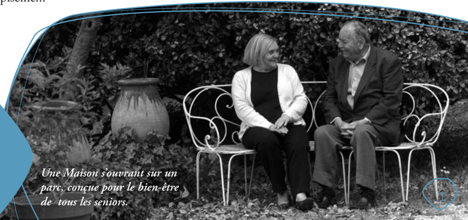
Une Maison s'ouvrant sur un parc, conçue pour le bien-être de tous les seniors.