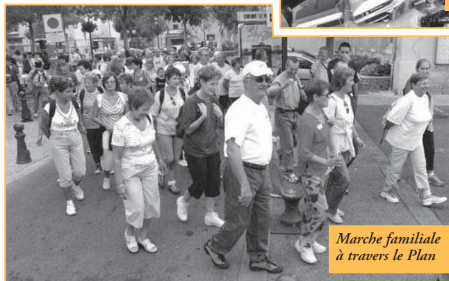
Marche familiale à travers le Plan