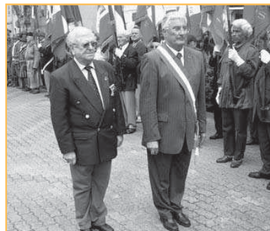
▲ La ville de La Garde présentée par un dépôt de gerbes le 18 septembre à St Maximin pour le souvenir de l'armée d'Afrique.