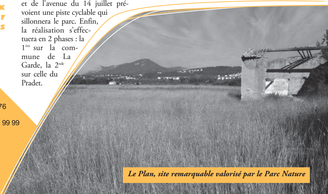
Le Plan, site remarquable valorisé par le Parc Nature