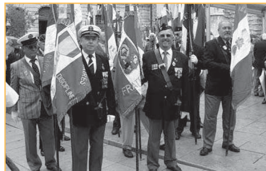
▲ Les drapeaux des anciens combattants gardéens également présents, accompagnés par près d'une soixantaine de Gardéens.