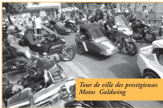
Tour de ville des prestigieuses Motos Goldwing