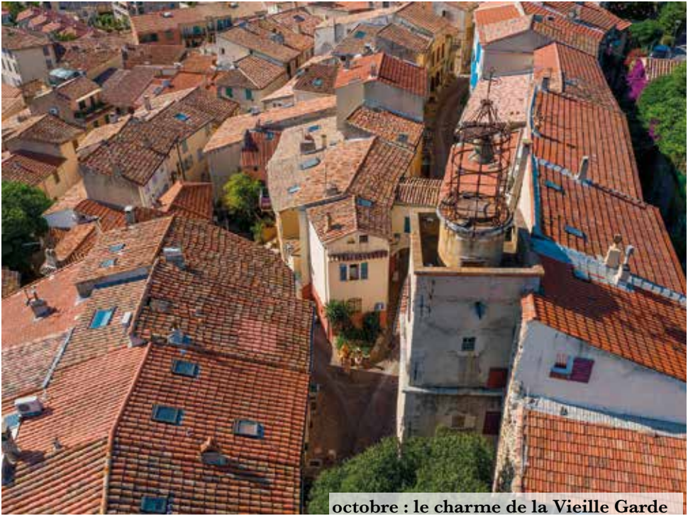
octobre : le charme de la Vieille Garde