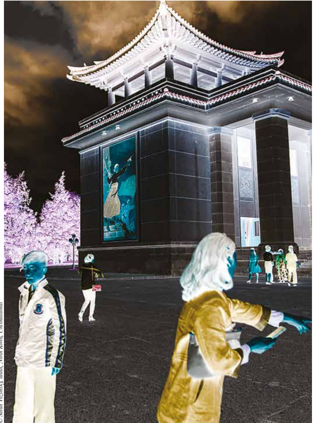
© Sarah Vozlinsky détail, North Korea, Unconditional

Galerie G - rdc Complexe Gérard Philipe - Rue Charles Sandro - La Garde mardis & vendredis 10h-12h & 14h-19h, mercredis 10h-12h & 14h-18h, samedis 9h-13h sauf jours fériés f GalerieG - service culturel : 04 94 08 99 19 / lagalerie@ville-lagarde.fr / Galerie G : 04 94 08 99 68